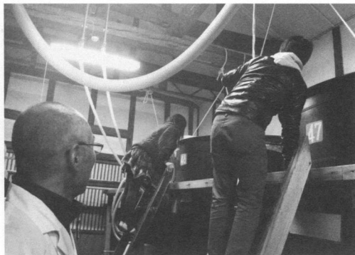
[写真2] 蔵元を見学し、日本酒づくりを学ぶ

さらに、[写真2]のように蔵元を訪問し日本酒の作り方を杜氏から直接話を聞きながら学び、近くの酒販店を周ることで、お酒の売られ方、買い方を自分たちの目で確かめた。また、身の周りでお酒を飲む人に深くインタビューをしていくなど、日本酒の消費のされ方について観察を進めた。さらに、それらの情報をもとに、ポストイットを使いながら、ブレイ