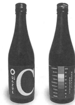
[写真3]山形エクセレントデザイン大賞を受賞したつや姫なんども

その他にも、山形の老舗企業2社とのコラボレーションにより生まれた「しみっだうま玉こん」や、UHA味覚糖の「特恋ミルク」のプロデュースなど、演習授業、有志でのプロジェクト、チュートリアルなど様々な課題に取り組み、成果を出している。