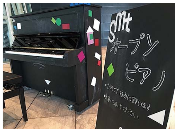
写真6:オープンピアノ

この、「新しい危機」がもたらす変化のすごさは、毎日知らされる「数値」によって、突然人々の考え方が変わってしまう「世界のあり方」、あるいは「世界のとらえ方」であろう。新