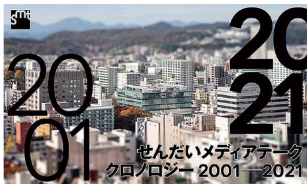
写真9:せんだいメディアテーク クロノロジー 2001—2021

やがて、前述の展示が終了した頃、「緊急事態宣言」は解除になり、2020年の秋からは様々な経済政策がはじまるが、2021年の2月には、またさらに感染者が（第4波）増大し、行政からの指示に従い、臨時閉館や時短開館を繰り返すことになった。もしも「コロナ禍」でなければ、この時点では20周年の事業として「円卓会議」 11 や「20周年記念書籍の発行」が計画されていたが、どちらもかなり前に延期や中止としていた。変わってその「円卓会議」での資料とすべく、せめてこれまでsmtで開催されてきた事業を総括し、全事業記録として編年的に編集するという事業「せんだいメディアテーククロノロジー 2001—2021」は行うことになり、下半期はこの「アーカイブ事業」に人手や予算を重点的にかけて行うことになった。本展は、smtのこれまでのあゆみ