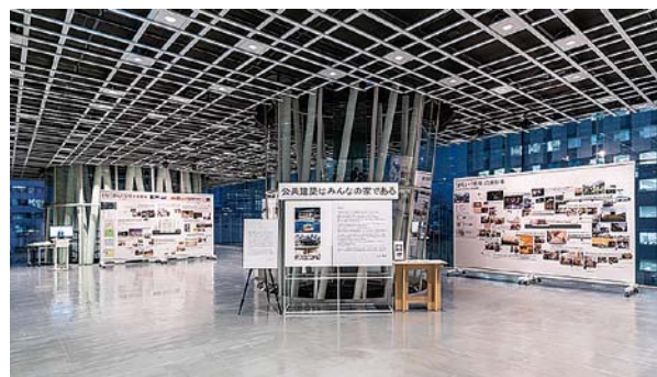
写真7:公共建築はみんなの家である展示風景

その様な閉塞した状況の中で「空きスペース」を有効に活用した展示が「公共建築はみんなの家である」展である。これは、伊東事務所が手がけた図書館や劇場など4つの公共建築、「せんだいメディアテーク」、「まつもと市民芸術館」、「座・高円寺」、「みんなの森ぎふメディアコスモス」の、キーパーソンや利用者、スタッフなどの声を取材し、詳細でわかりやすい相関図にまとめたものである。写真7、8の通