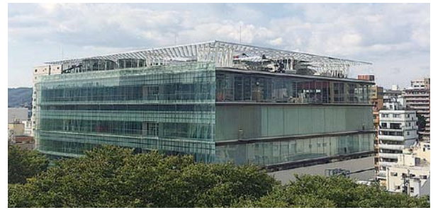
写真1:せんだいメディアテーク外観

仙台市の公共文化施設である「せんだいメディアテーク（以下smt）」 1 では、2019年は、開館から20年目を迎える様々な周年事業が計画された節目の年だった。しかし、年をまたいで中国の武漢市に端を発し世界中に拡大した新型コロナウイルスは「世界のあり方」を一瞬にして変えた。またこの「新しい危機」の影響は、特に社会的弱者に甚大な