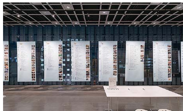
写真10:せんだいメディアテーク クロノロジー 2001—2021 展示風景

地味なアーカイブ調査は評価が難しいと思われるだろうが、それらの作業が今回で全て解決したわけでは無く、時間が流れている以上、現在進行形で取り組まなければならないと言える。