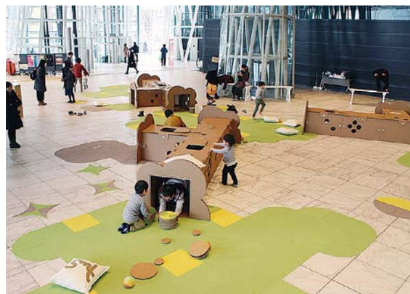
写真5:こどもスクエア