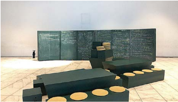
写真3:てがつくカフェ

と考える議論ができればと願いつつも、その後の10年の間には、「公共文化施設」によせる様々なところからの期待も、また求められる意義も格段に変わってきたといえるだろう。つまり、是非なく社会における存在感が強くなったと言える。