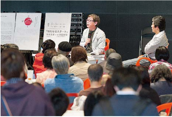
写真2:あるきだすために