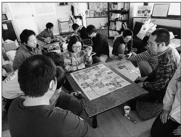
写真① ある日のフリースペースのようす(2014年)

「ぶらほ」では、活動の始まりから終わりまでの16年間休むことなく、誰でも参加できるフリースペースが常時開設され、その活動があらゆるとりくみの中心に位置づいていた(写真①)。主に毎週水曜から土曜までの日中に開放されていたそのスペースは、若い世代に位置するさまざまな立場や年代、境遇の人びとが常時10人以上集うたまり場となっていた。