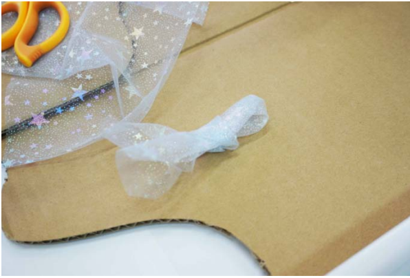
写真10:「宝石のある世界」からイメージして、お魚を作る素材もキラキラしたものを選んでみた。