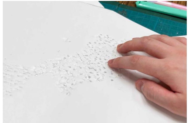
写真3:スチレンボードの表面にシャープペンで細かい凹凸をつけた。細かい連続した刺激がある。