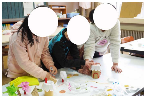
写真6:鑑賞に熱が入り、子どもたちの手が密集し「手の国」となる。