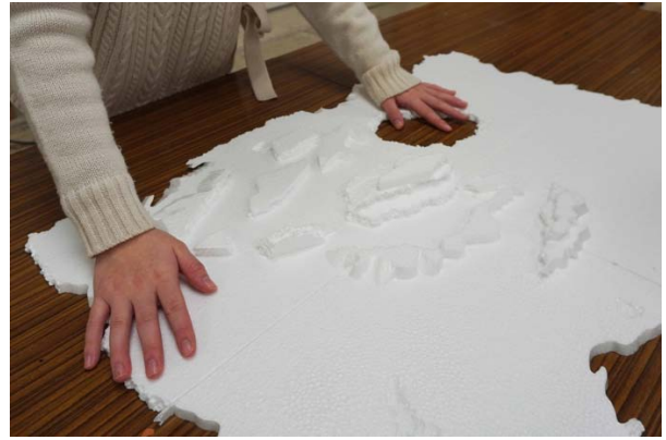
写真2:厚みを感じるように発泡スチロールの土台は端の形を工夫。

また、先ほど制作した土台もアイマスクをした状態で触れてもらった。サンプルの土台は、中央に穴を開けたり、山のよう突起物をつけるなどの工夫があったが、アイマスクをして触れると「障害物があると広い面積を感じられない。」「世界がそこで終わっている感じがする。」といった意見が生まれた。逆に、スチレンボードにペンチを突き刺して表面をザラザラにした質感は、「ツルツルの部分と差があって面白い」といった意見が出た。