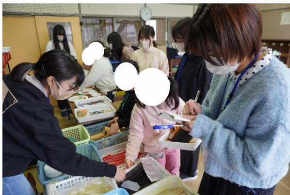
写真7:気になる素材をバイキング形式で集める。

「『ゆめの国』を作るために『土地』を選ぶところからスタートします。」と子どもたちに伝えると「土地!」と大きく反応してくれた。授業タイトルやそこで扱う言葉を考えて準備したことが、世界観を作り出し子どもたちを授業に引き込む機能を果たした。「土地」選びは、こちらで想定していたよりもスムーズに決まり、教室の前方にある素材選びに移った。素材はバイキング形式で使用するものを自分のカゴに入れてもらった。