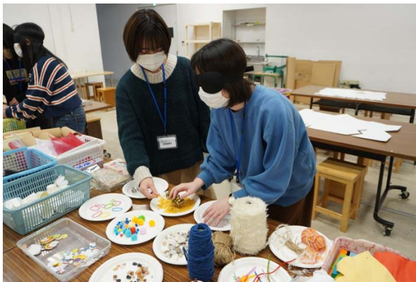
写真1:1人が誘導して素材に触れさせる。

また、前回の授業参観で、子どもたちが手で様々な素材に触れてそこで感じたことを話す様子が見られたことから、改めて触れることの重要性を考えた。子どもたちが普段感じている感覚を体験するために、学生にアイマスクをした状態でアトリエ内にある素材に自由に触れてもらった。2人1組になり、1人がアイマスクをした学生を誘導し、素材に手を伸ばしてもらおう。視覚を遮断し、触覚を大切にすることで、普段触れている素材でも感じ方が変化する。普段、いかに視覚に頼っているかがわかる体験だ。