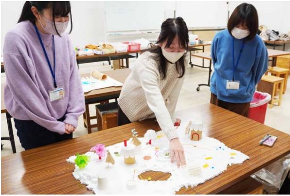
写真4:目を閉じて他のグループの作品に触れて鑑賞する。

このように、子どもたちの感じている世界を学生も感じようとする体験を通して、素材に対するとらえ方が広がった。この経験が授業を準備する際の指針となり、子どもたちにどんな部分を楽しんでほしいか、という授業目的を考えることにつながった。